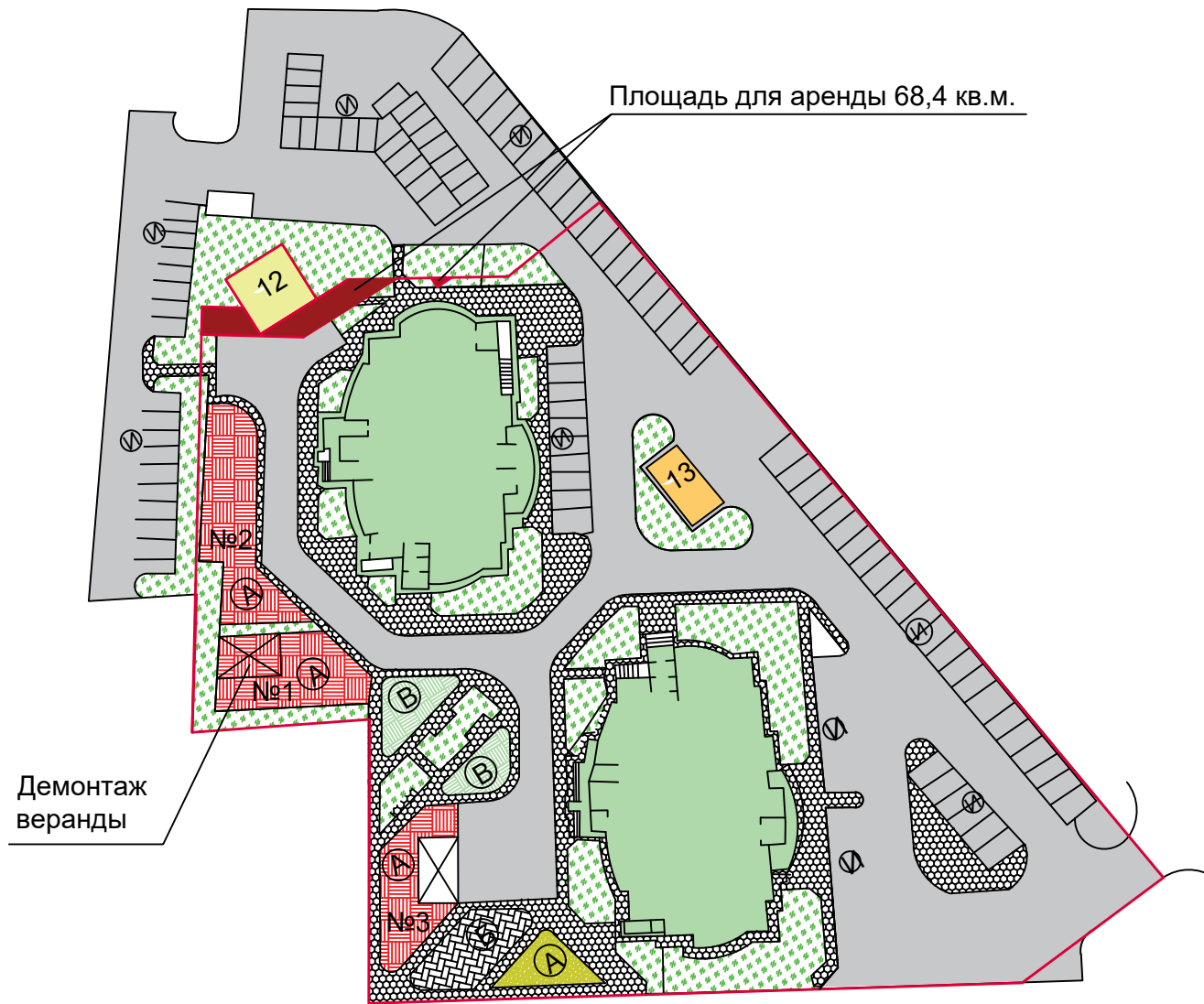
Площадка №1 S=168 кв.м.